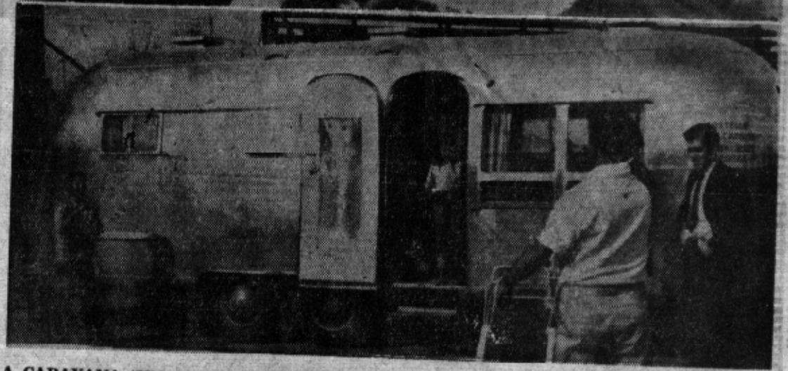
LA CARAVANA "WALLY BYAM'S" registra una organización perfecta en todos sus aspectos. Sólo en esa forma puede realizar su recorrido sin interrupciones. En la gráfica superior el Banquero hace algunas operaciones financieras. ABAJO. Uno de los "trailers" durante la estancia en Cd. Juárez.