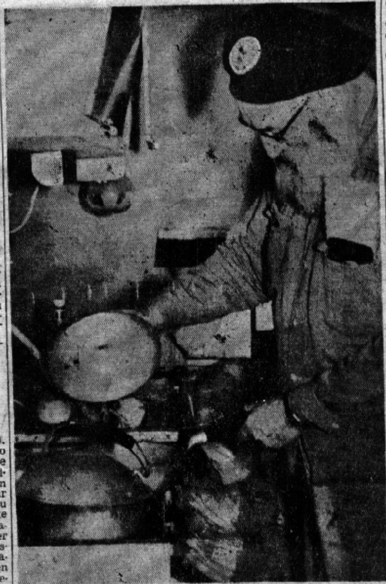
Personas de espíritu noble e ideas de amistad y servicio integran la Caravana Rostros pintorescos y agradables como el de este Santa Claus que lo mismo cocina que zurce sus calcetines. Elementos de limpio pensamiento en un afán de hacer muchos amigos mexicanos.